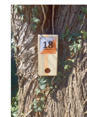
Balise à trouver