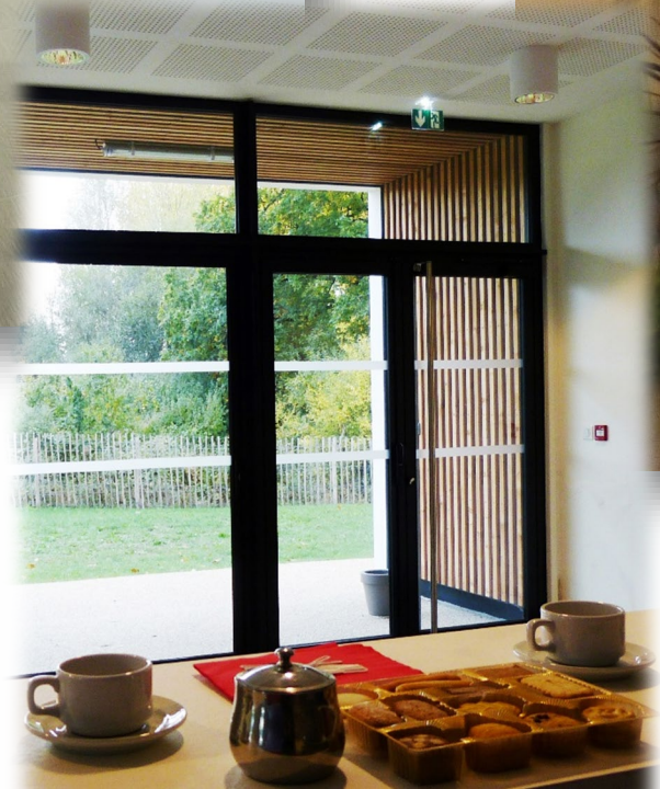
Suggestion de présentation