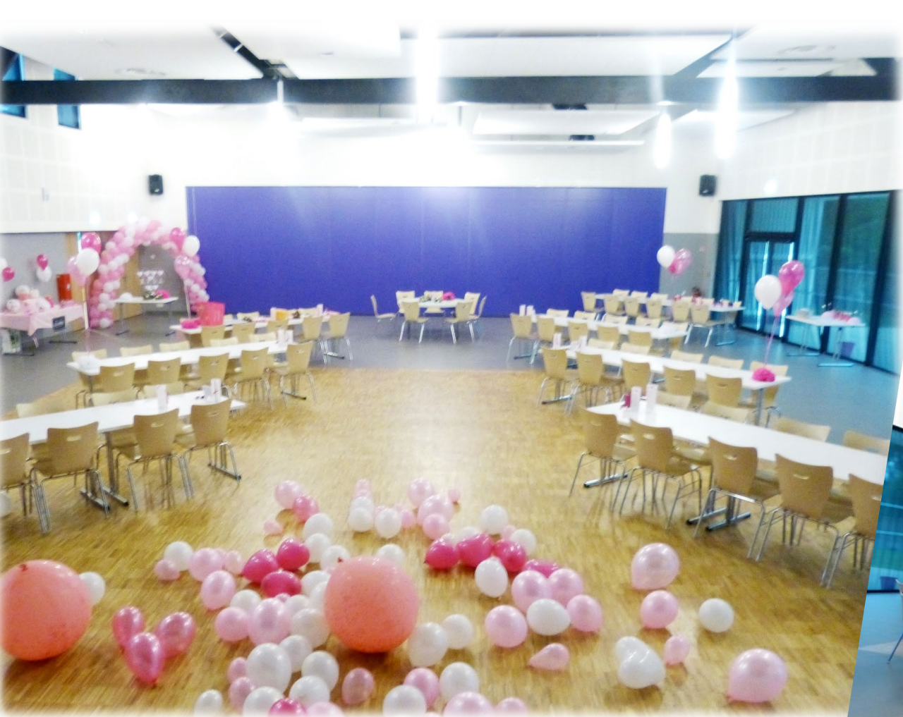
Exemple de configuration de réunion familiale