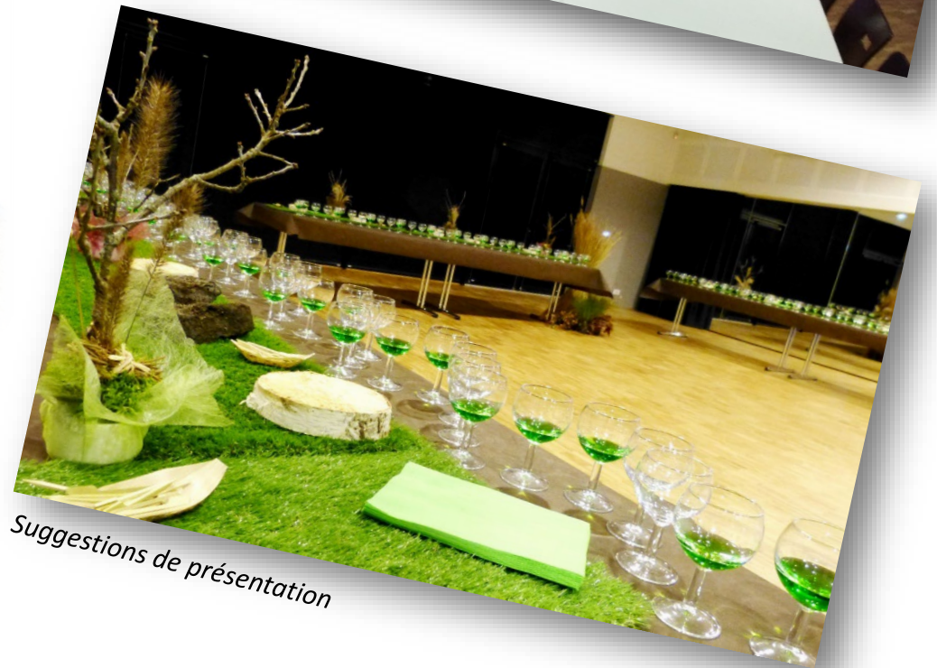
Suggestions de présentation