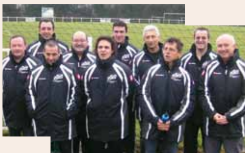
L'équipe des dirigeants de l'ASL Football

• Inscriptions : Il est toujours possible pour les jeunes (fille/garçon, dès 6 ans) de signer une licence pour pratiquer le football en vous adressant auprès de Claude BODET 6 rue des Ajoncs à St-Lyphard (02 40 91 39 49) .